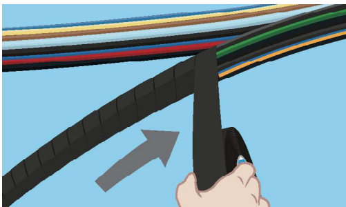
捆扎操作从顶端开始向主线束部分缠绕